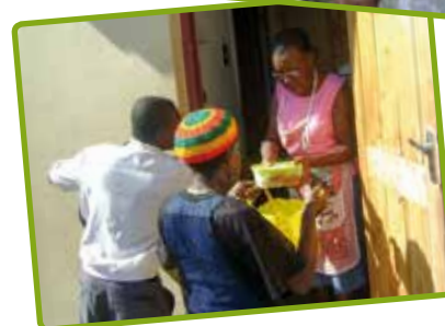
Smakelijk eten, namens de kerk!

Uw steun voor dit project is welkom. Ons banknummer: NL74 RABO 0375 216 936. Vermeld 16.011 Jamaica.