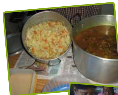
Groente, rijst en een beetje vlees

Op dit moment steunt het ZZg een voedselhulpproject van de Trinity-kerk en twee andere Broedergemeenten voor de armen in hun wijk. Vrijwilligers koken wekelijks een maaltijd en geven aandacht en geestelijke bijstand aan zo'n 185 mensen. Het project wordt gefinancierd door kerkliden, lokale sponsors en het ZZg. Een blik hierop: